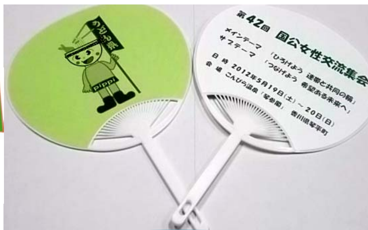
名産品のうちわ！かわいいサイズ♪