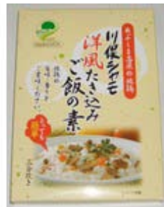
川俣シャモ洋風たき込み ご飯の素 (ピラフタイプ) 3合用