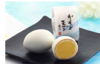
ミニかもめの玉子 9個入り