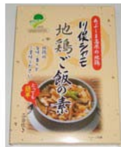
川俣シャモ地鶏ご飯の素 3合用