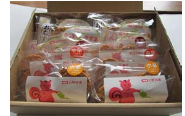
きっと芽が出るせんべい 詰め合わせ (小)