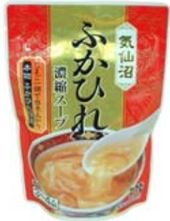
気仙沼産ふかひれ濃縮スープ 3~4人前