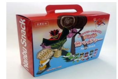
南部煎隊「煎ベイジャー」 コンプリートボックス