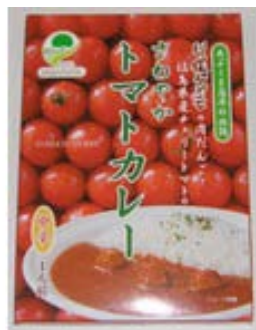
川俣シャモさわやか トマトカレー 1人前