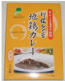
川俣シャモ地鶏カレー 1人前