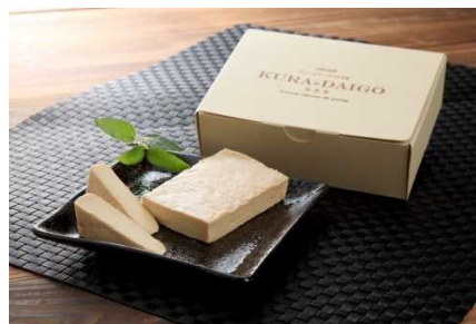
クリームチーズのみそ漬け 75グラム (約7cm×10cm) 1050円