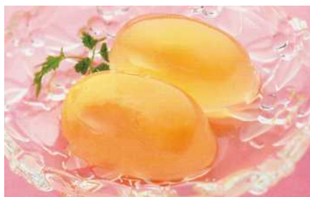
うつくしまゼリー 3個パック 730円

【ナカちゃんからひとこと】 福島は果物王国！ 冷凍してシャーベットにしてもおいしいよ！